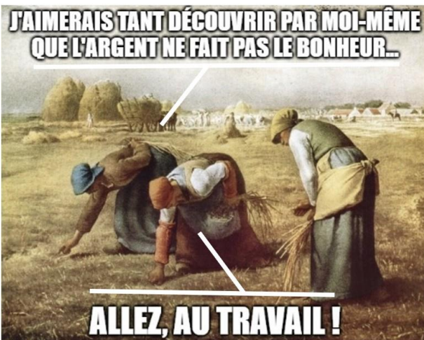
Peinture de Jean-François Millet, Des glaneuses (1857)

Bravo ! Le collégial reconnaît enfin votre précieux apport !