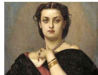
Auguste Toulmouche, Portrait de femme

À gagner : L'une des deux cartes-cadeaux de 25 $ de la brasserie Chelsea & Co (dont la terrasse est tout à fait enviable, selon les rumeurs). Pour participer au tirage, il faut nous envoyer votre réponse avant le jeudi 4 avril 2024 à 15 h en cliquant ici . Nous avons bien hâte de vous lire !