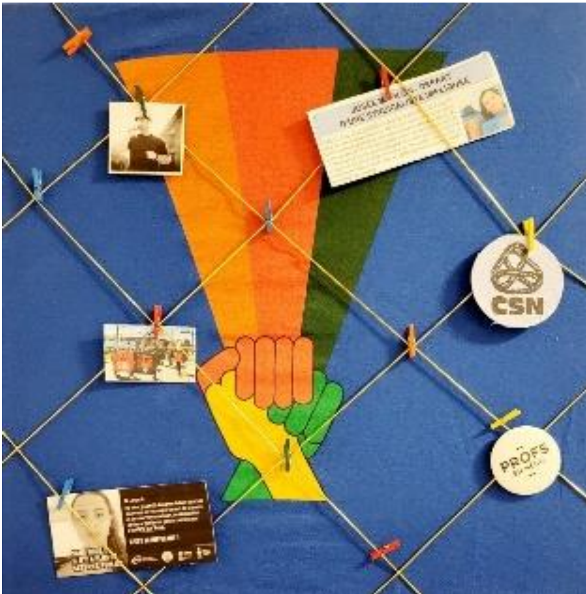
Œuvre d'art d'Annie Gironne