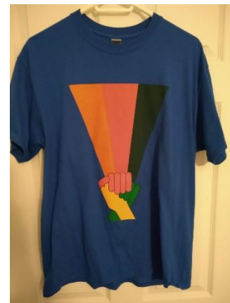
Photo du t-shirt auquel elle souhaite une mort atroce : Lyne Beaumier

Le concours est ouvert aux membres du SEECO, et le tirage au sort aura lieu le jeudi 16 décembre 2021 à midi . Nous avons hâte de vous lire ! Pour participer, veuillez cliquer ici .